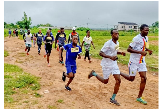
Erster Solilauf 2019 in Bassila, von uns finanziell unterstützt