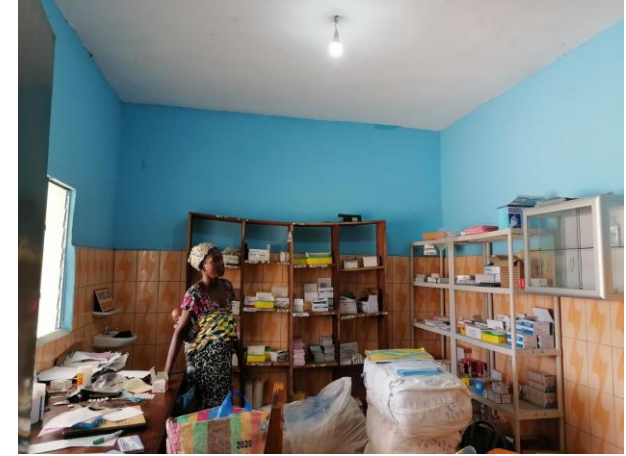
Licht durch Solarmodule für Krankenstationen